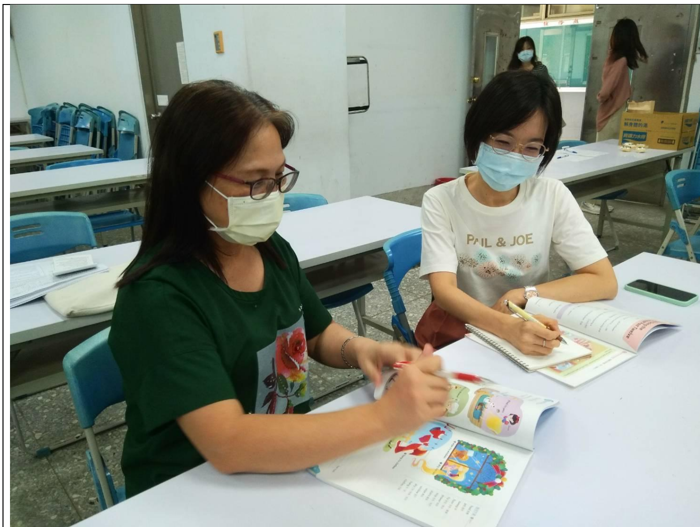
照片1說明：觀課前議課