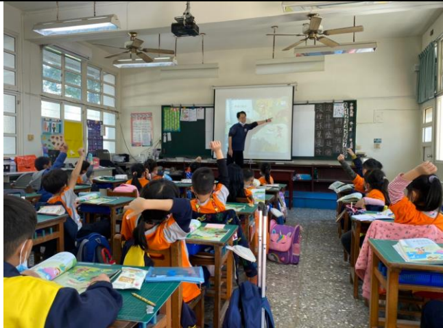
說明：老師搭配電子書上課，效果顯著，成功引起孩子專注與興趣。