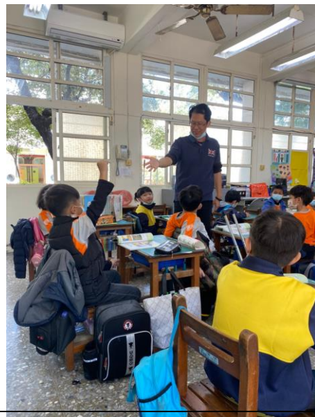
說明：老師進行行間巡視，並提問孩子問題，與孩子進行良好互動。