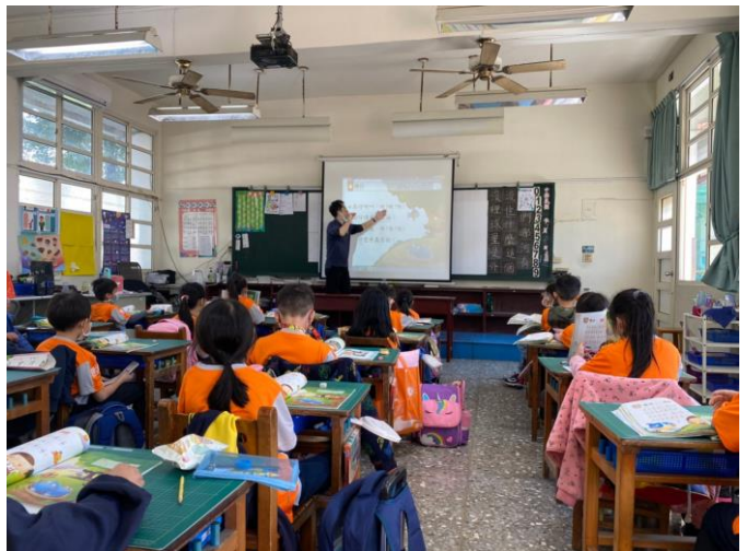
說明：老師明確指出正在上課的內容，讓學生能更精確跟上朗讀台語課文。