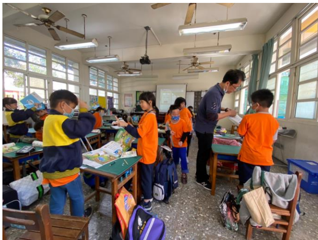
說明：老師進行分組討論，讓孩子更樂在課程討論中。除此之外，老師也同時注意到個別學生並進行指導。