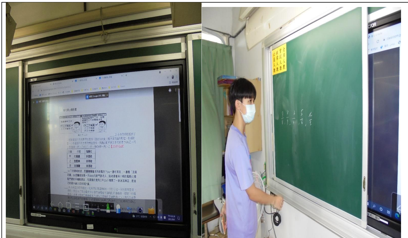
照片1說明：(課程引導講解)