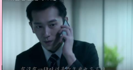
有沒有一種味道是你怎麼也忘不掉的