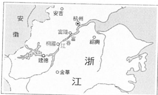
▲富陽至桐廬地理位置圖

語譯 一江水都是青綠色的，千丈深的水底也可以看得很清楚，水中游動的魚和細小的石子，也可以毫無阻礙的直接看到。水流得很急，比飛箭還快，洶湧的波浪，就像奔騰的駿馬。 ●虛無縹緲：形容虛幻渺茫，不可捉摸。 ②縹碧 青綠色。縹，音ㄆㄧㄢˊ，淡青色。 ③急湍甚箭 水流得很急，比飛箭還快。湍，音ㄊㄨㄢˊ，急流。甚，超過。（詳見P111-3）