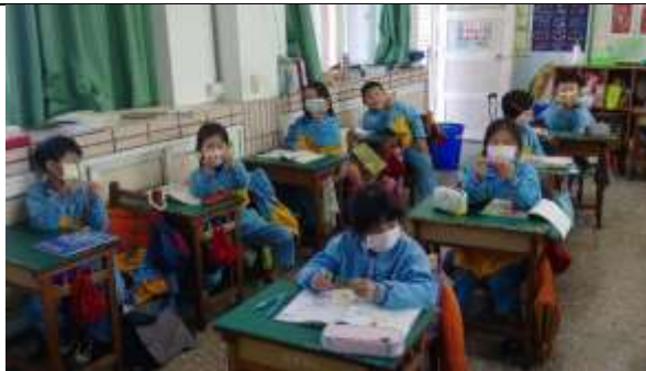
公開授課照片 3：學生發表