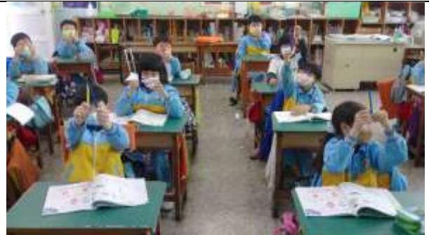
公開授課照片 2：學生發表