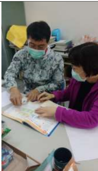
議課照片 1：教學過程討論