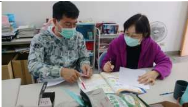
說課照片 1：說明教學科目及單元