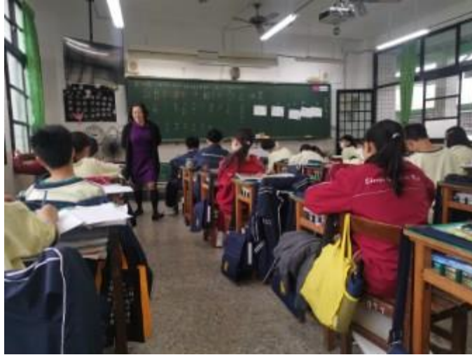
老師巡視學生書寫筆記作答情況並給予適度協助