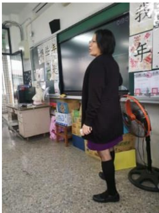
透過電子書相關資源進行教學活動