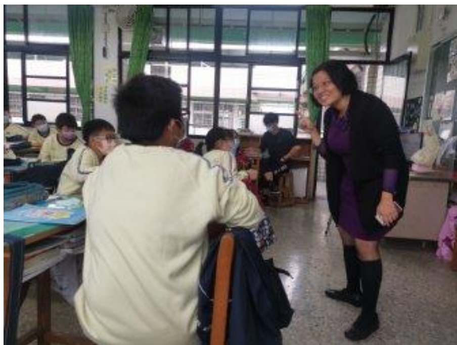
老師鼓勵學生回答問題