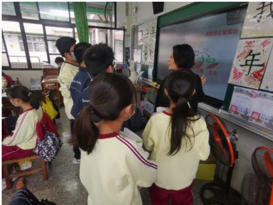
學生與老師共同討論