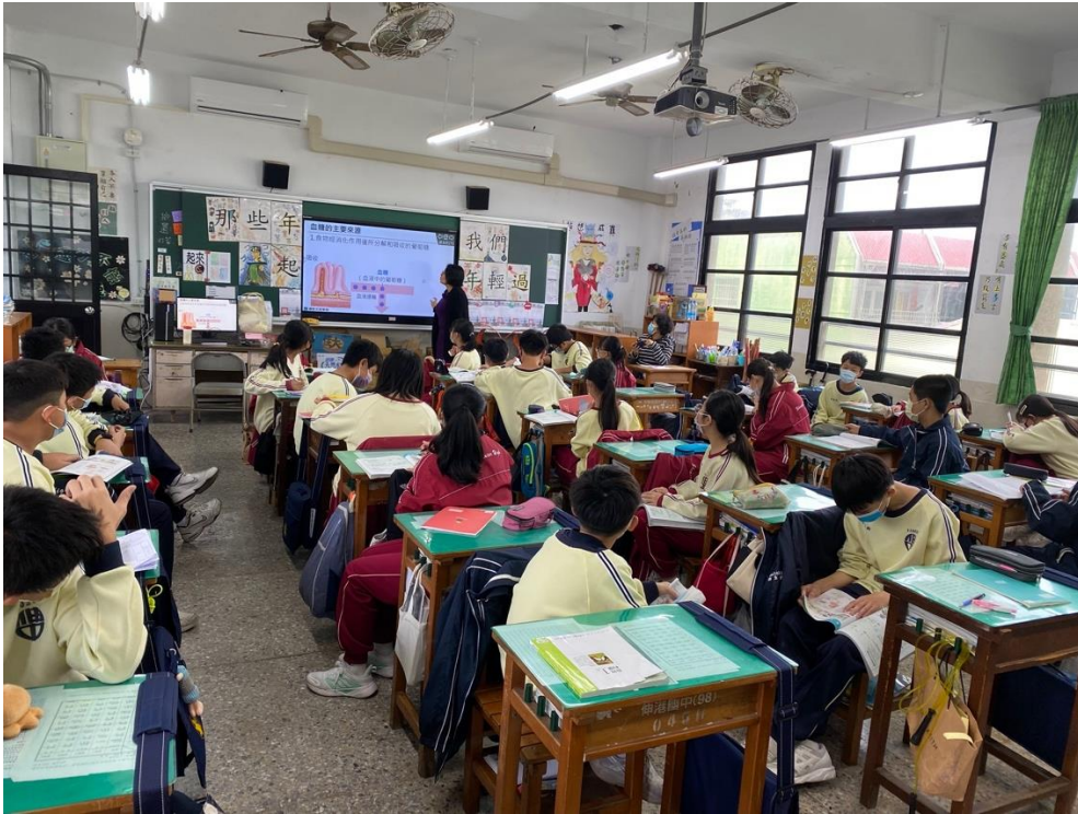
教學觀察學生專心上課及參與回答學生專心上課及參與回答