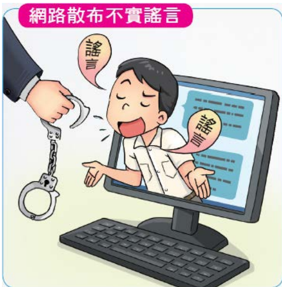
網路散布不實謠言