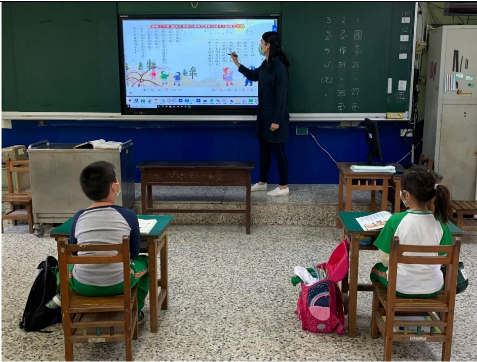
全班一起找出第一段的詞語