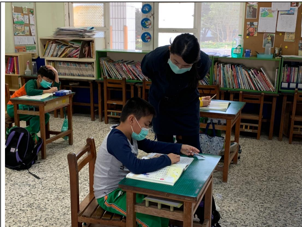
小朋友試著找出第二段的詞語，詢問老師：「穿得」是一個詞語嗎？