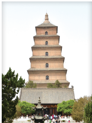
▲圖3-2-5 西安大雁塔今貌／該塔始建於7世紀中期，用於存放玄奘從印度帶回來的佛教經典、文物。