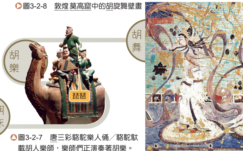
▲圖3-2-7 唐三彩駱駝樂人俑／駱駝馱載胡人樂師，樂師們正演奏著胡樂。