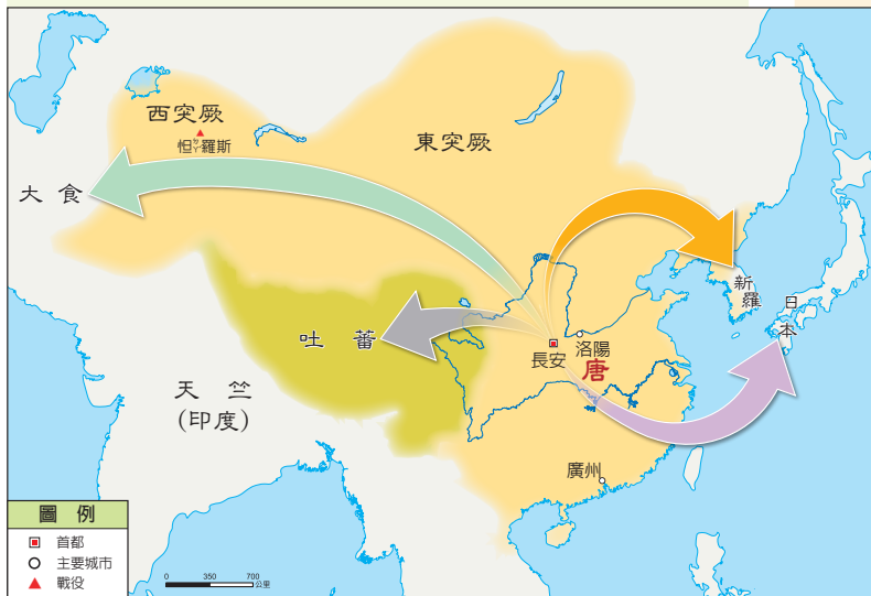
圖3-2-9 唐文化向外傳播示意圖

朝鮮半島北部，一度被漢代納入版圖，後來獨立建國為 高句麗 ，勢力擴及現今中國東北地區。隋唐時期，朝鮮半島南部的 新羅 ，全力模仿中國的漢字、曆法、儒學和佛教，因而有「君子國」之稱。