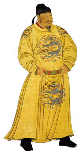
圖3-2-4 唐人畫筆下的唐太宗李世民政權繼位後，知人善任、容納直諫，開創了大唐盛世。