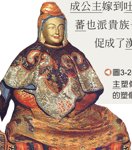
圖3-2-10 西藏大昭寺中的文成公主塑像／此為1970年代重修復原的塑像。

唐代吐蕃（今西藏）勢力強大，唐帝國採取和親政策籠絡吐蕃，太宗時 文成公主 嫁到吐蕃（圖3-2-10），吐蕃也派貴族子弟到唐帝國留學，促成了漢藏間的文化交流。