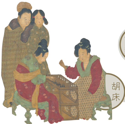
▽圖3-2-6 唐代內人雙陸圖／此圖為唐代畫家於8世紀所繪。圖中正在對奕的仕女坐在竹籐編織的椅凳上，此椅凳為唐代受到胡風影響下的新興家具。

商周至隋唐時期，中國與周邊各民族文化交流密切，生活習俗相互影響，其中包含宗教、藝術及日常生活起居等方面。