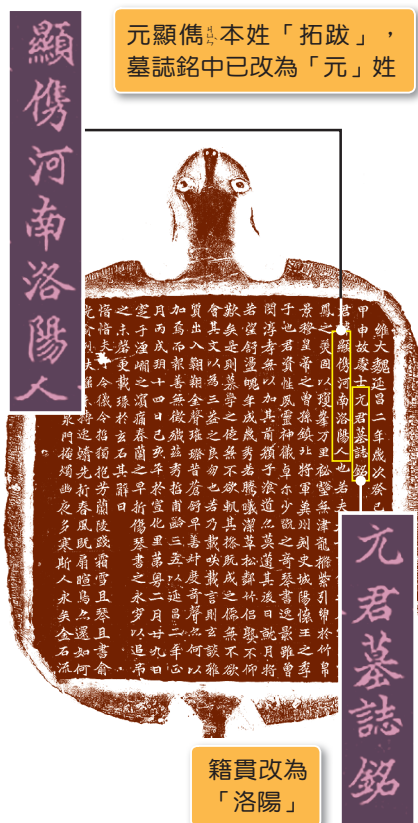
圖3-2-2 北魏元顯僞墓誌／北魏政權規定貴族改胡姓為漢姓，例如：原姓「拓跋」的鮮卑人，必須改漢姓「元」。