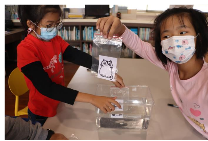
我把身體變透明了