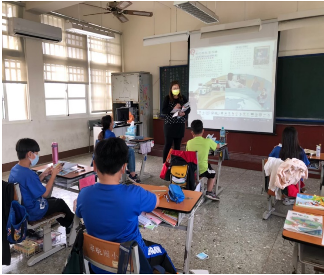
教學照片（至少四張）