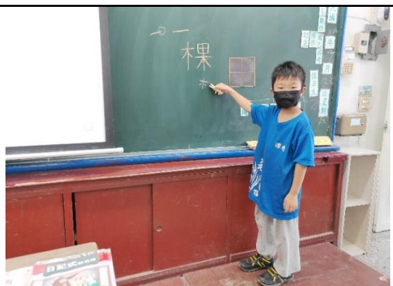
老師掌握學生愛發表的特性，讓學生上臺發表生字於「田字格」小黑板上。