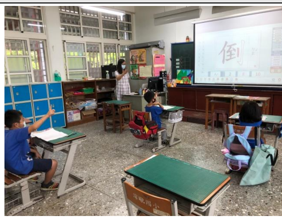
教師引導學生念出筆順及筆畫名稱，請學生書空寫出來。