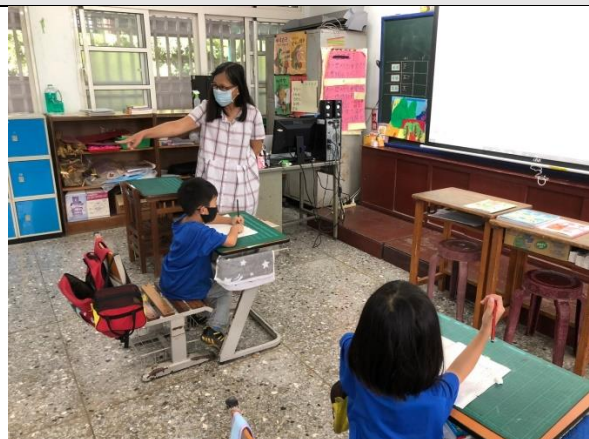
進行筆畫、筆順綜合練習。