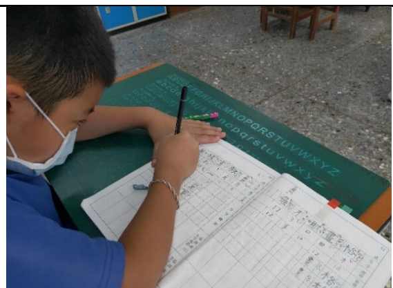
將揭示的生字、部首、總筆畫數寫於生字本上。老師逐一檢視及做必要修正。