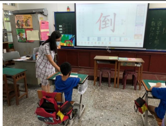
學生於書空後習寫生字，將揭示的生字、部首、總筆畫數寫於生字本上一次。