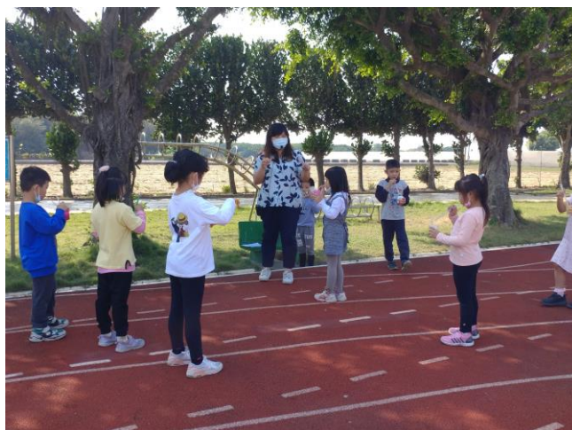
嘗試用大小吸管吹泡泡