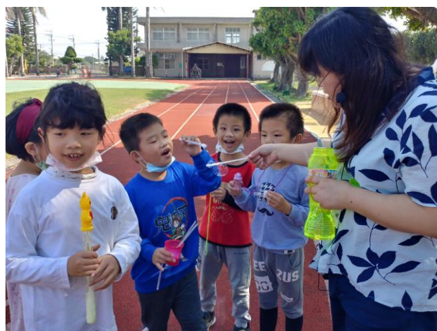
試著吹出一條毛毛蟲