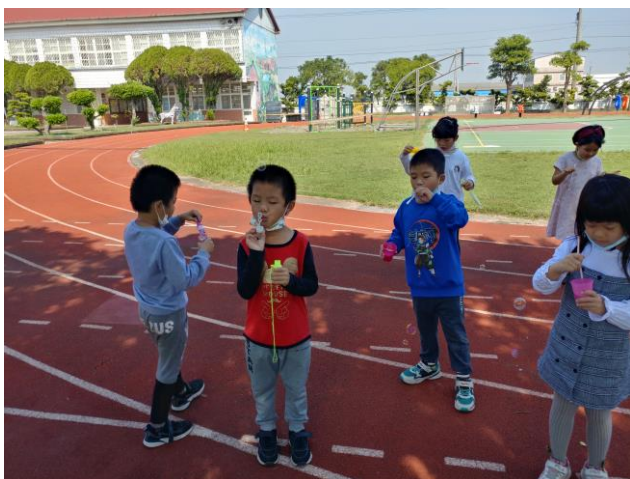
嘗試用大小吸管吹泡泡