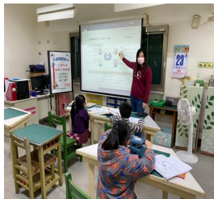
教導心智圖學習單書寫策略