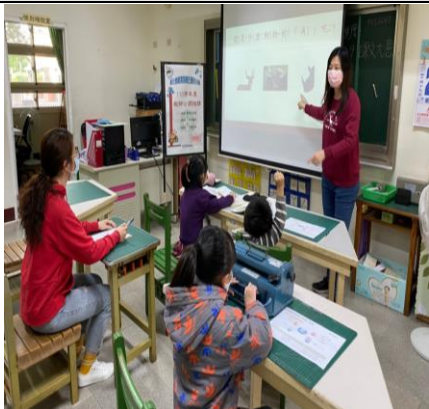
說出是哪種動物的「角」