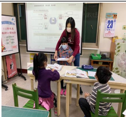
上台分享心智圖學習單