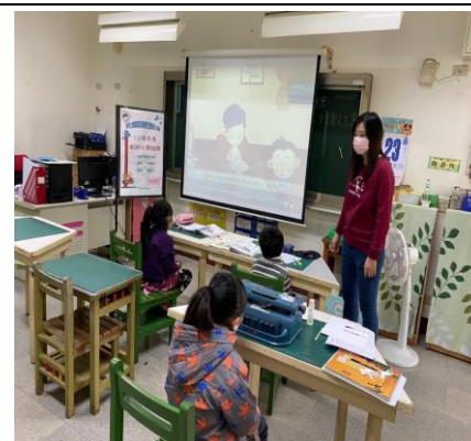
短片欣賞:天生我材必有用