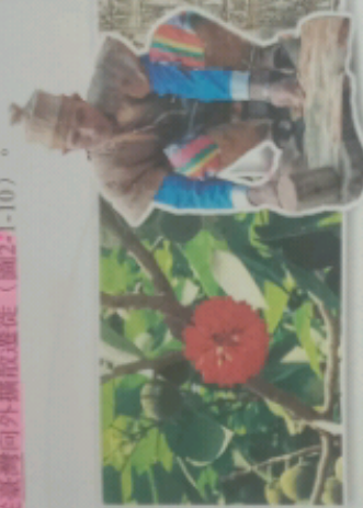
圖2-1-9 構想與太平洋南島語族的起源地