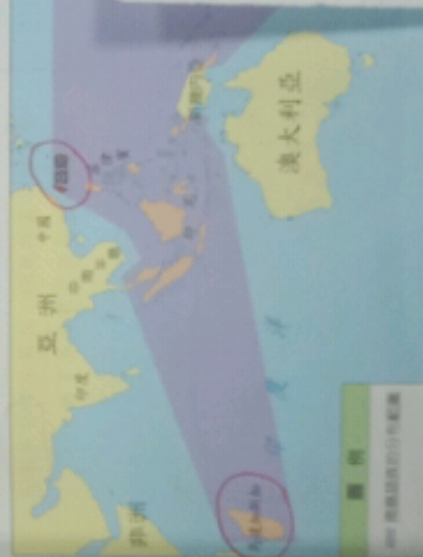
圖2-1-10 南島語族分布圖/南島語族分布於太平洋和印度洋