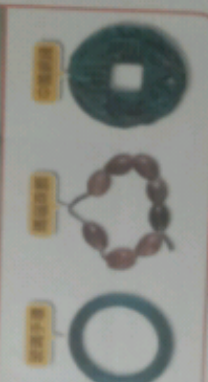
圖2-1-8 十三行文化遺址出土器物