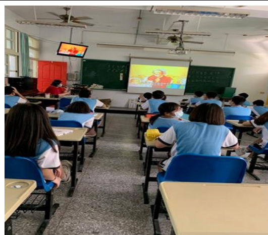
欣賞 莫札特的故事