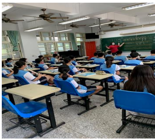
練習吹奏 驚愕交響曲主題

一、 教學者分享授課心得：(如說明教學設計理念、學生學習重點、授課心得…) 設計理念：採用康版教科書的內容，針對本校學生的學習與社區環境背景，選取在媒體較常聽到的樂曲為教學的橋樑。 學習重點：1、了解古典樂派的社會文化背景。 2、認識古典樂派音樂風格的特色與樂器的發展。 3、認識此時期重要音樂家的生平、重要作品及貢獻。 授課心得：古典樂派重要的音樂家，雖然一般都列舉海頓、莫札特與貝多芬三位，但他們三位的作品數量很多，只能挑選最具代表的樂曲介紹，有點可惜，應可要求學生上網搜尋資料，採分組報告，既可讓學生能自主學習又能訓練發表能力。 二、 觀課者回饋觀課心得： 1、以樂句分段，重複仿奏，達到精熟學習之效。 2、以播放「驚愕交響曲」與作曲家相關影片，加深印象，又可理解交響曲與古典音樂會的禮儀。