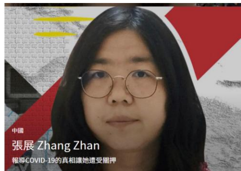
報導 COVID-19 真相讓他遭受關押