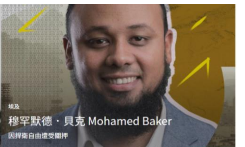
因捍衛自由遭受關押