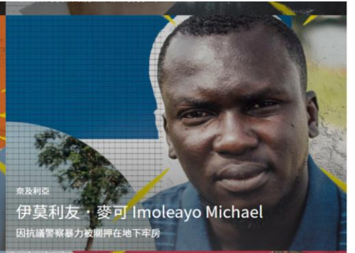
因抗議警察暴力被關押在地下牢房