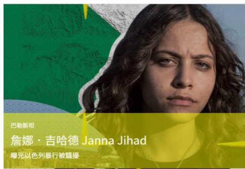
曝光以色列暴行被騷擾