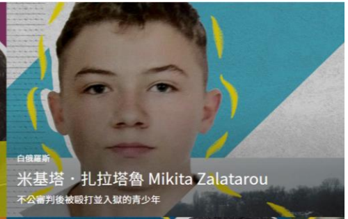
不公審判被毆打並入獄