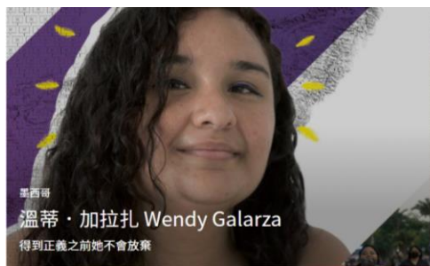
得到正義之前她不會放棄