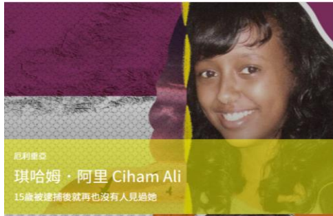
15歲被捕再也沒有人見過她