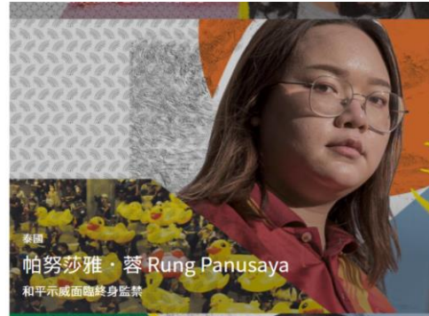
和平示威面臨終身監禁