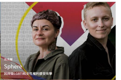
因捍衛LGBTI和女性權利遭受攻擊