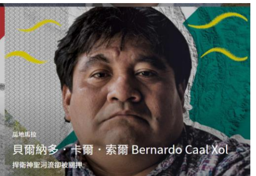
捍衛神聖河流卻被關押