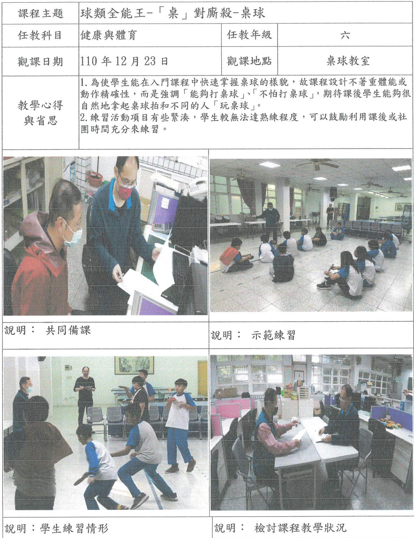
110 學年度彰化市國聖國小觀課議課成果表