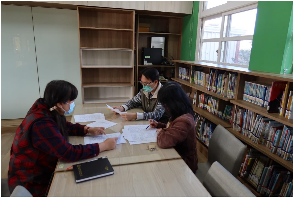
活動：課前共備 日期：110 年 12 月 30 日