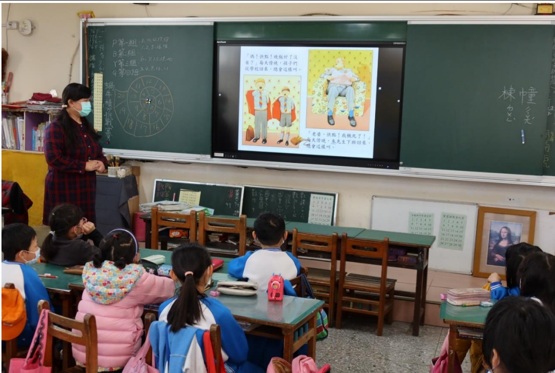
活動：教室觀察 日期：111 年 1 月 4 日