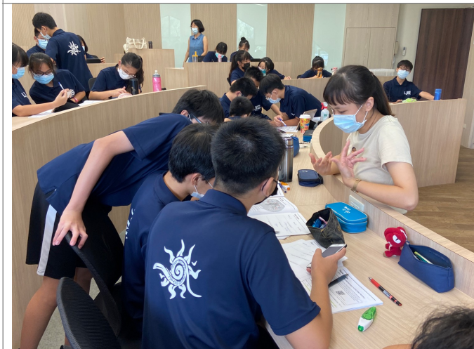
公開授課（分組討論）