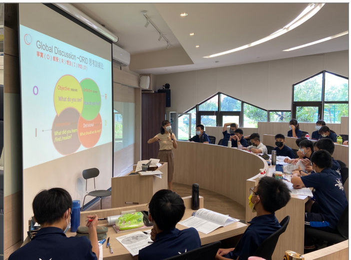
公開授課（講述說明）