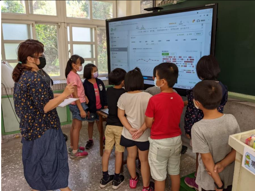
學習吧-課文唸讀反饋