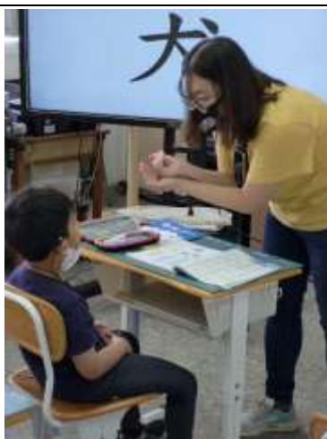
潛能開發班教學現場