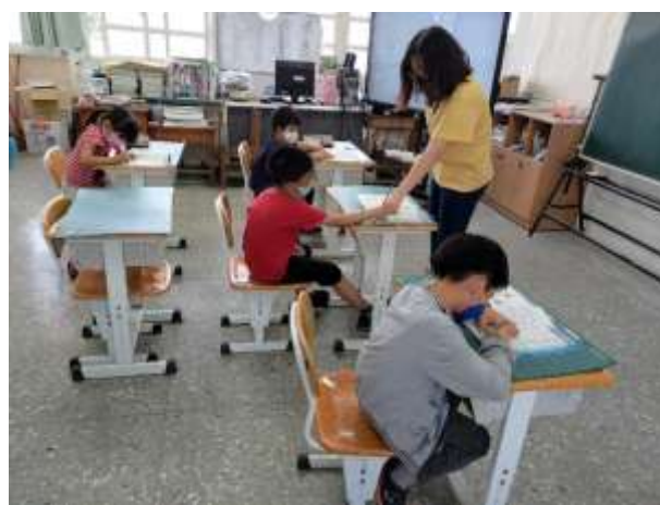
潛能開發班教學現場