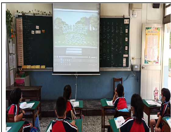
看動畫 --- 最開心