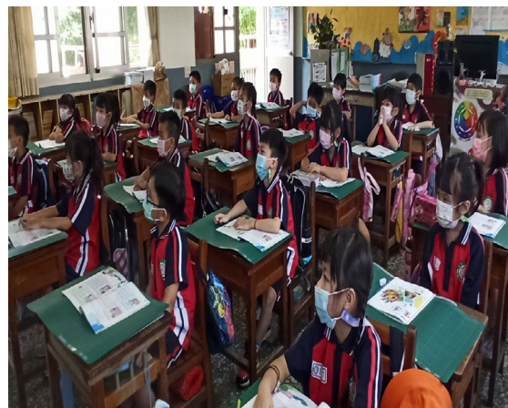
我們都很專心上課哦！