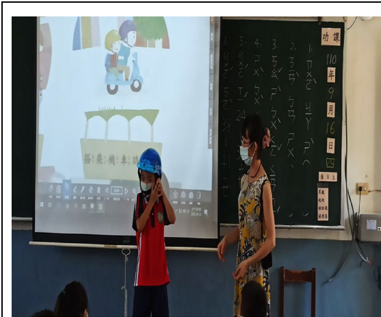
有小小老師在示範哦！