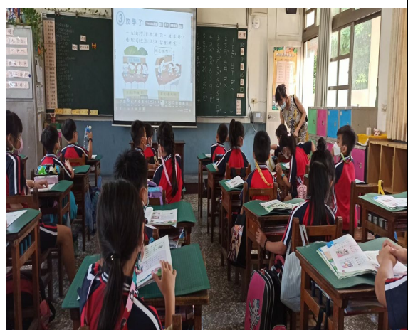
專心！老師在行間巡視！