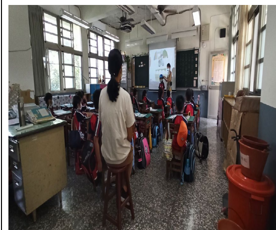
噓！有老師在看我們上課！