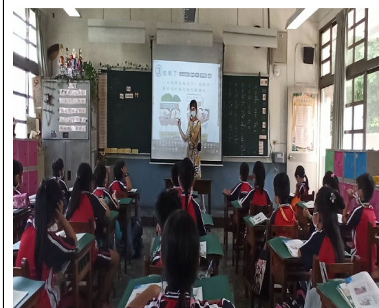
老師正在認真講解