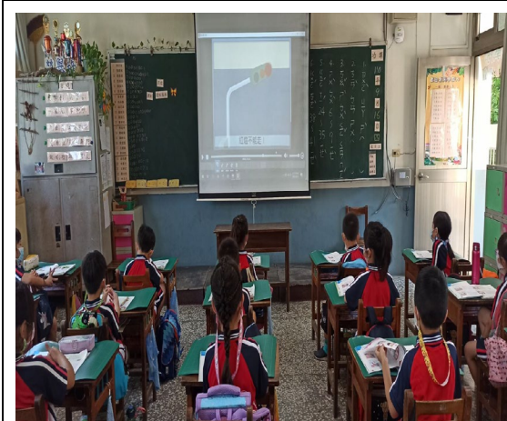
我們正在認真做題目哇！