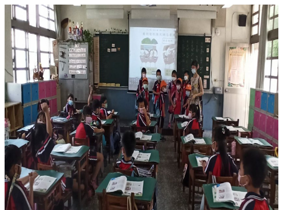
注意看！同學在做示範