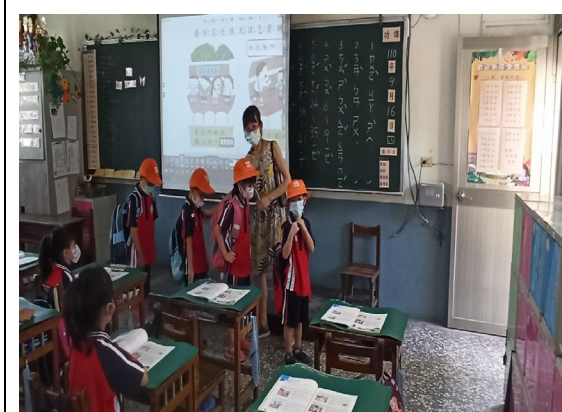
注意聽，等一下才會做