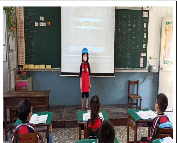
有小小老師在示範哦！