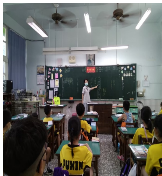
《老師說明小朋友句子上不完整的部分。》