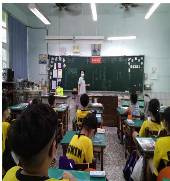
《老師請小朋友練習分析句子的結構。》