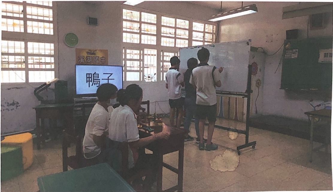
設計競賽遊戲讓學生上台練習