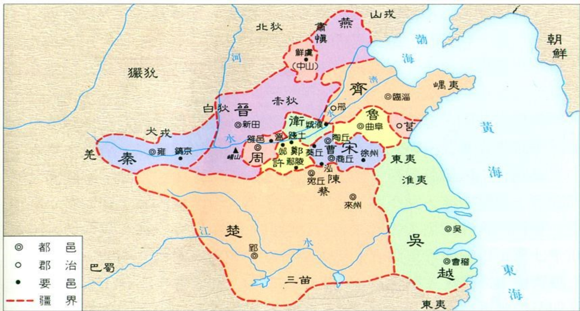
圖 3-1 春秋形勢圖