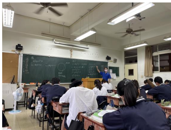
課後議課 (日期: 110.11.16)