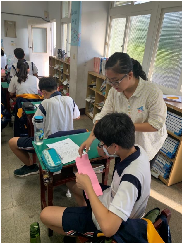
為學生進行進一步示範