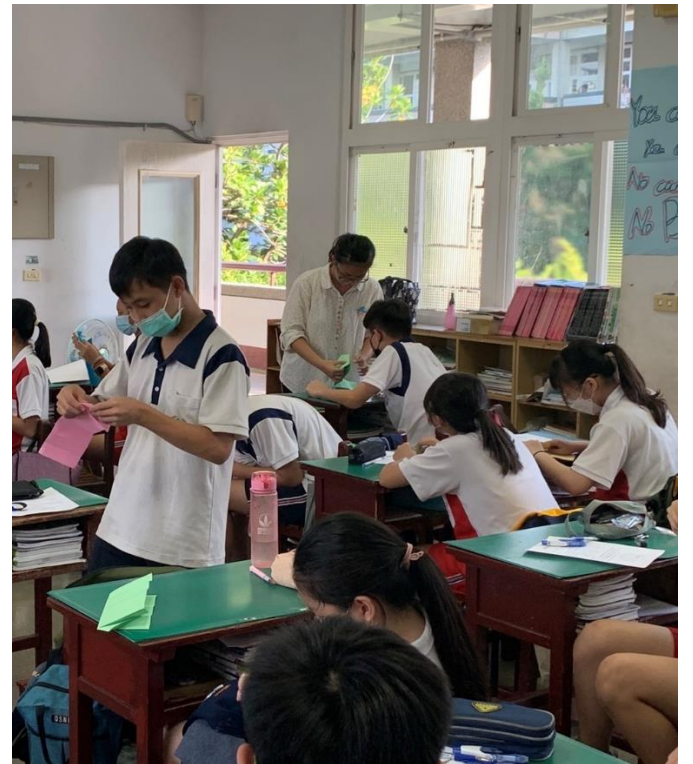
為學生進行進一步示範