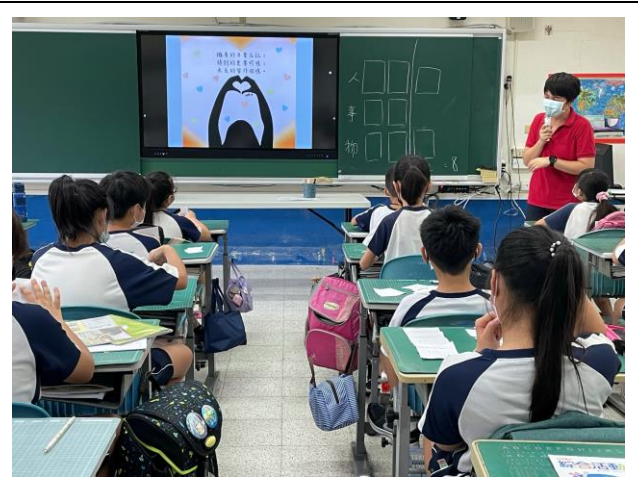
說明：進行課程總結