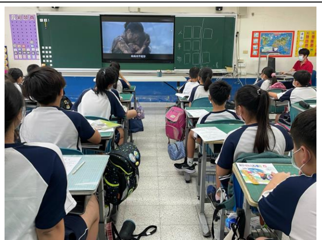
說明：觀賞與課程相關的影片