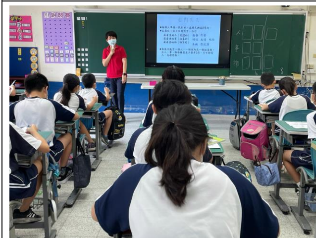
說明：進行體驗活動