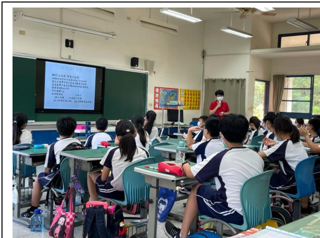
說明：進行生命教育主題課程