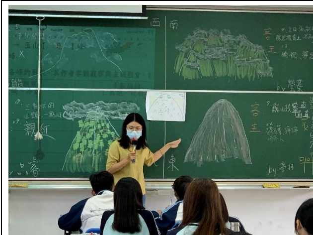
文本搭配學生繪圖分析玉山群峰的主、客寫作手法。