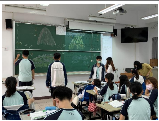
學生討論與作答情形。