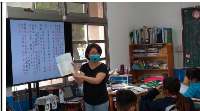
利用 PPT，老師和學生討論作文標題及重點。