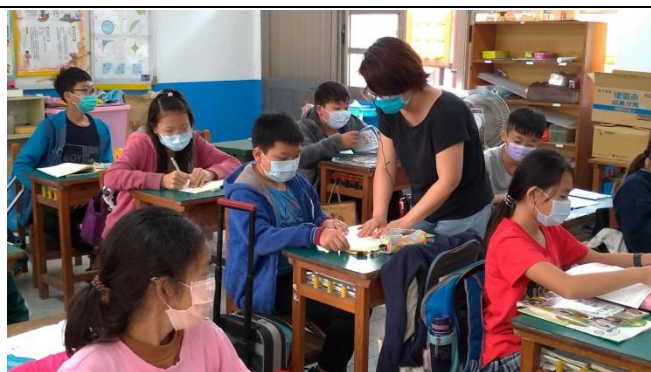
老師走動關心學生的寫作，並和有疑問的學生分別討論。