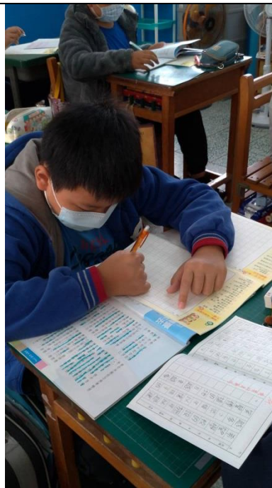
利用「22種人生」，學生完成自己的作文。