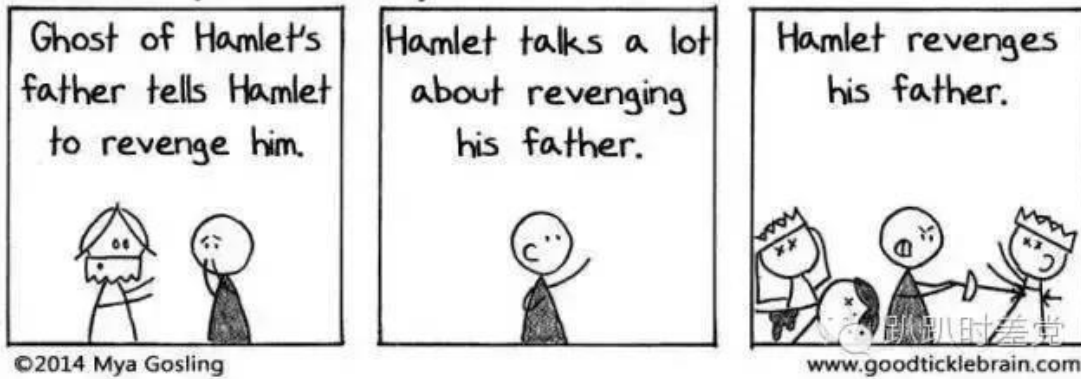
HAMLET (in 3 Panels)

哈姆雷特父親的鬼魂讓哈姆雷特替自己報仇；哈姆雷特不停念叨說要替父報仇；哈姆雷特替父報仇成功。