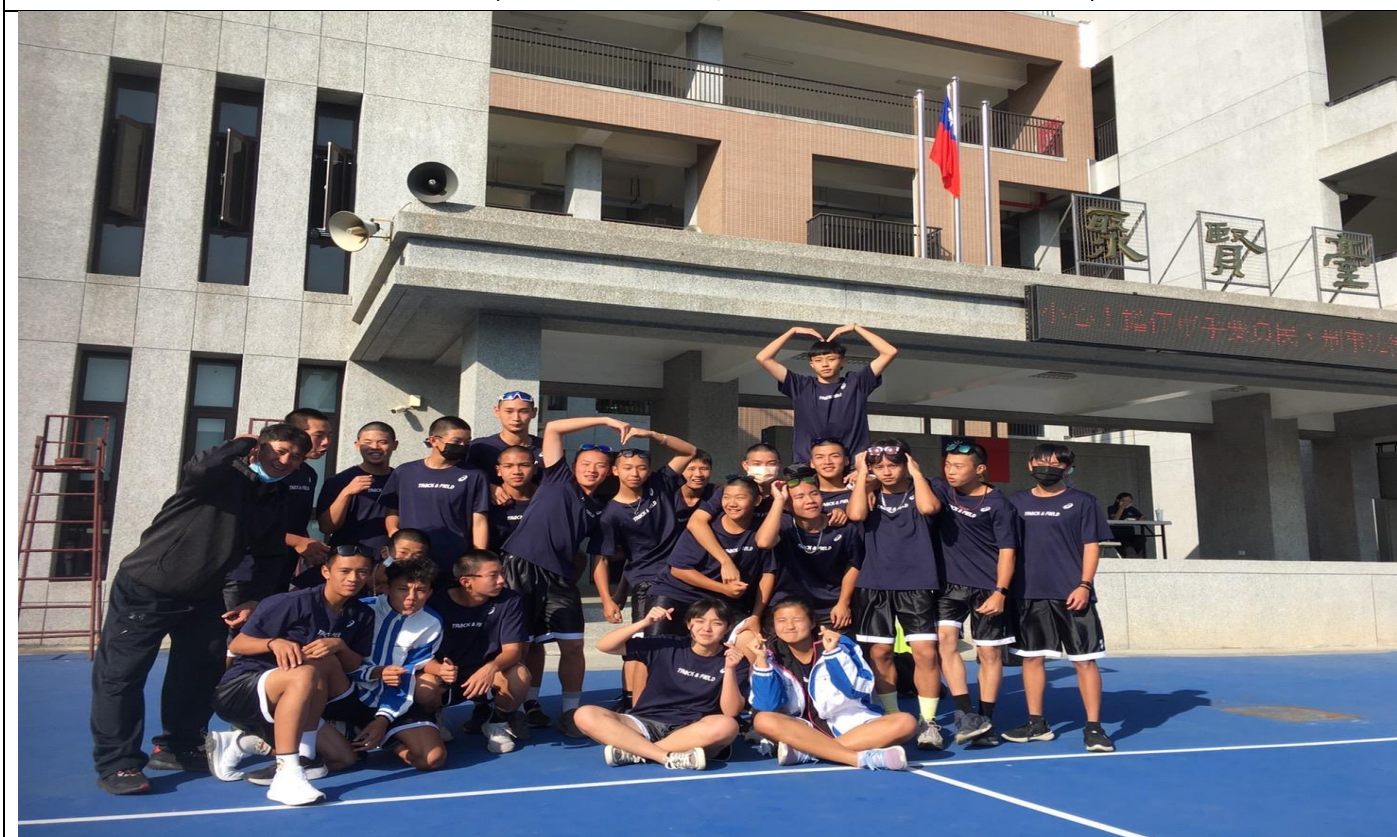
說明：舞蹈-運動會大會操教學活動