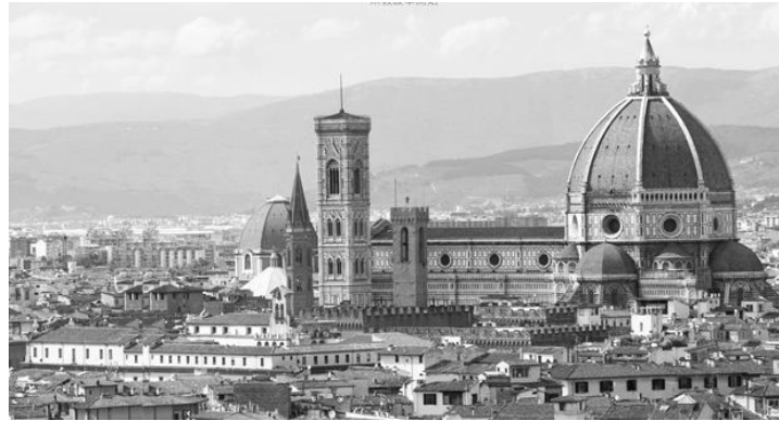
義大利佛羅倫斯聖母百花大教堂 (Florence Cathedral)