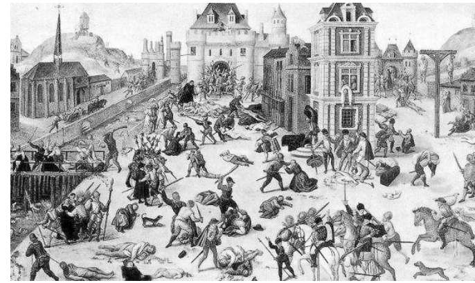
1572 年 8 月 24 日法國聖巴托洛繆大屠殺

四 _____ 教派（創立者法國人 _____，1509-1564 年，於瑞士 _____ 建立）