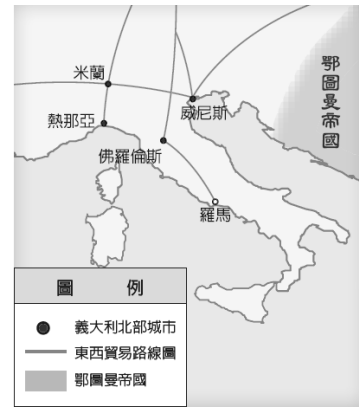
15 世紀義大利北部城市