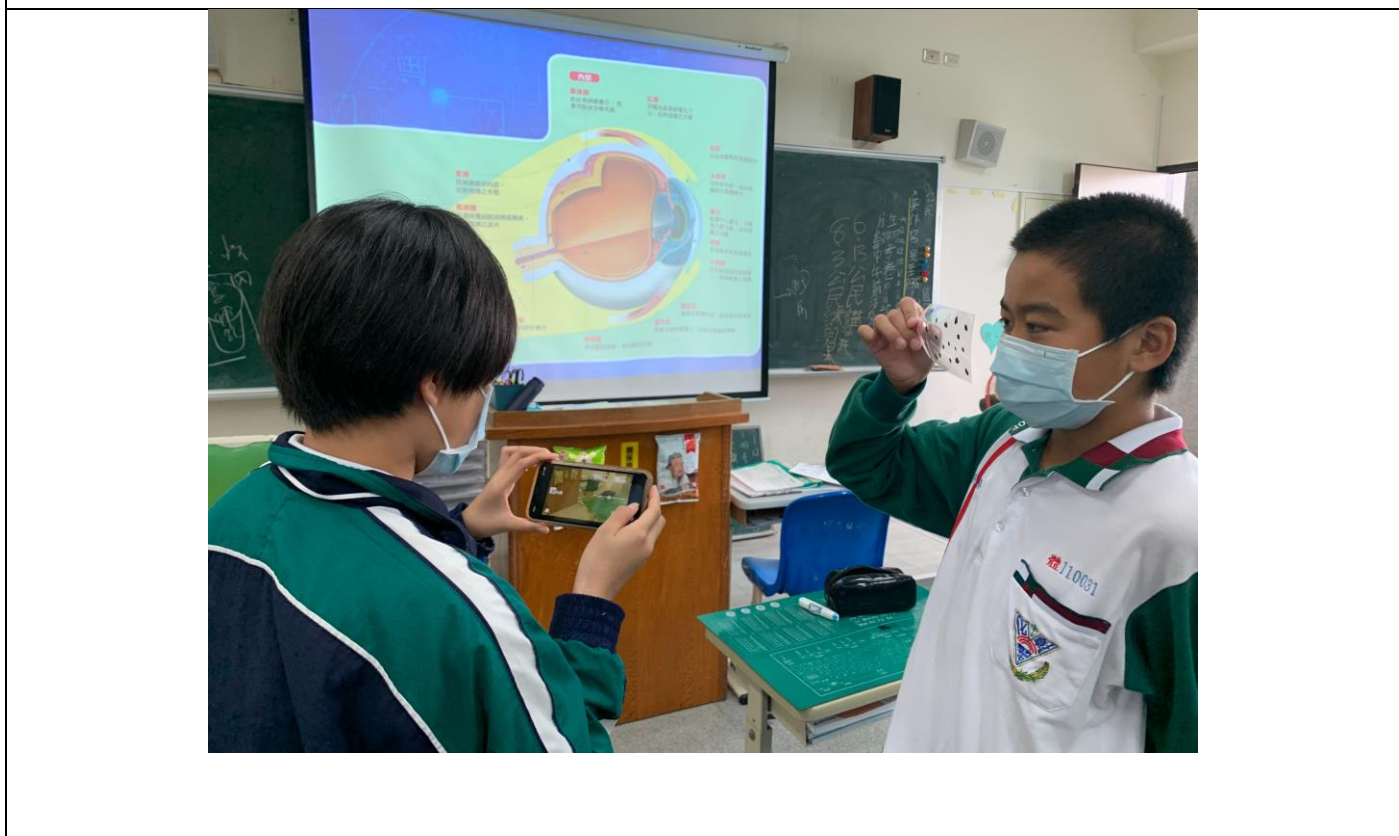
照片2說明 手機 APP 體驗