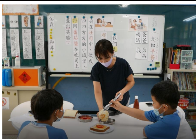
相片說明：學生將利用實物，依照句子出現語詞順序做出來，將句子畫面化。