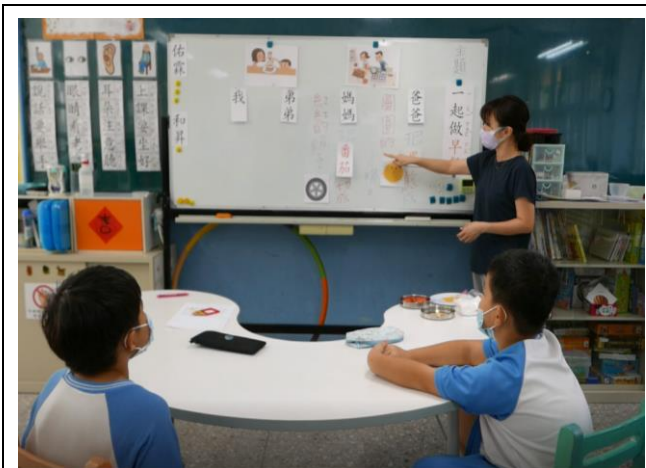
相片說明：引導句子-媽媽切的番茄是什麼形狀，像什麼物品，學生發表造句。