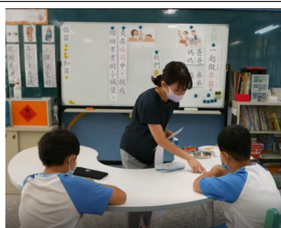
相片說明：針對學生需求給予個別指導。