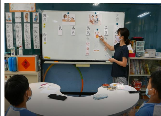
相片說明：說明句子-爸爸「煎」蛋用火煎，講解「火」的部首在生字中的構成。