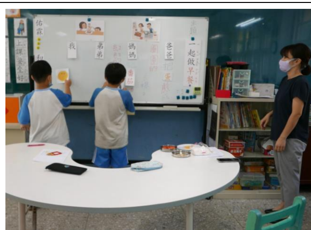
相片說明：讓學生上台張貼句子中出現的物品。