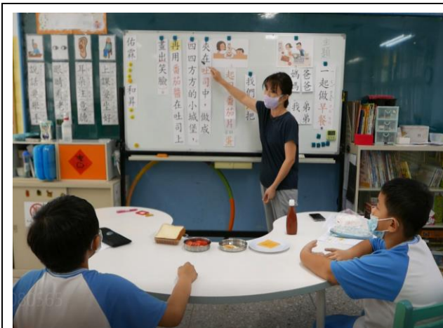
相片說明：帶領學生唸讀句子，說明「先…再…」中動作的優先順序。