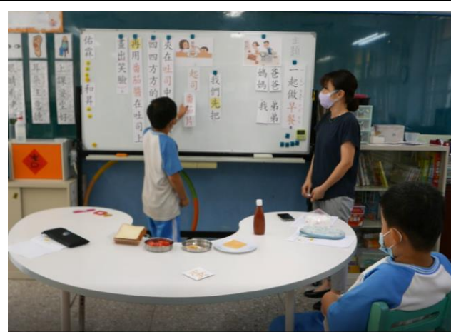
相片說明：學生上台拼貼出正確的語詞出現順序。