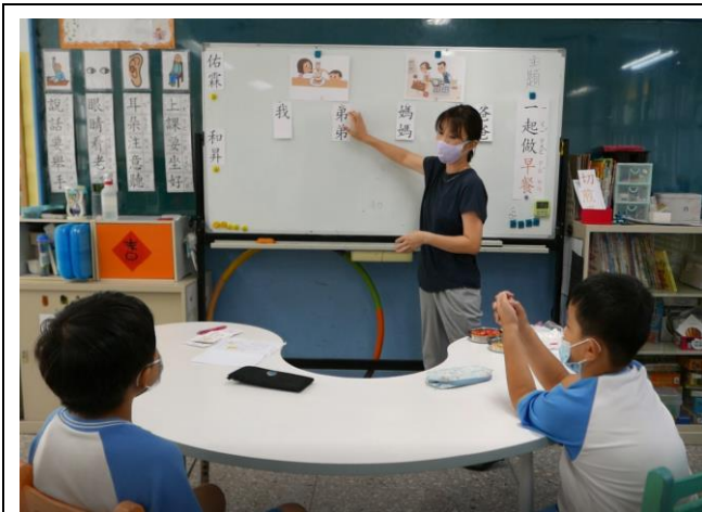
相片說明：引起動機-討論與家人用餐的經驗。說一說我喜歡吃什麼早餐。