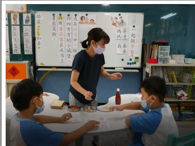
相片說明：讓學生將與磁卡與實物做配對練習。