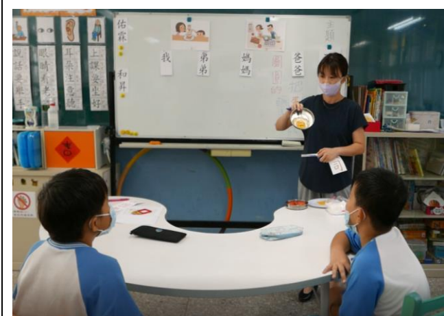
相片說明：展示學生自己煎的蛋，讓學生說一說蛋是什麼形狀。