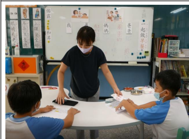
相片說明：唸讀學習單進行活動二的句子。