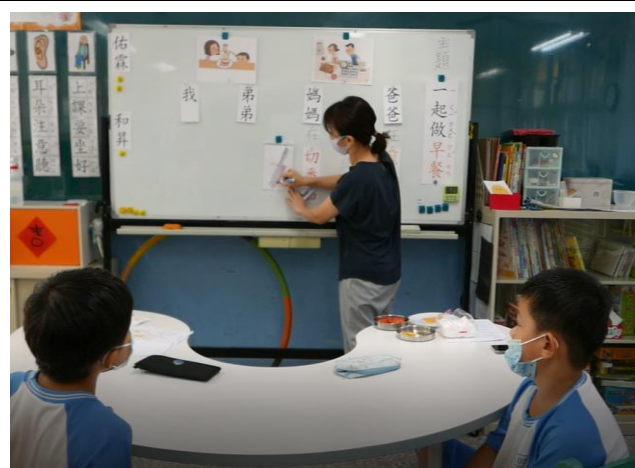
相片說明：說明句子-媽媽「切」番茄，講解「切」的部首在生字中的構成。