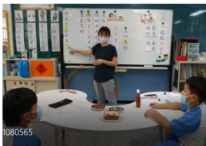
相片說明：針對學生本節課上課表現作加分與檢討。