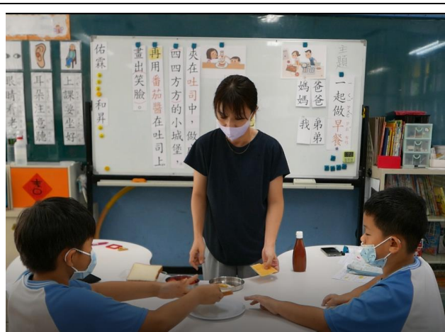
相片說明：學生將利用實物，依照句子出現語詞順序做出來，將句子畫面化。