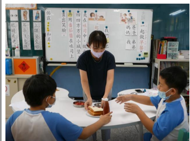
相片說明：學生將利用實物，依照句子出現語詞順序做出來，將句子畫面化。