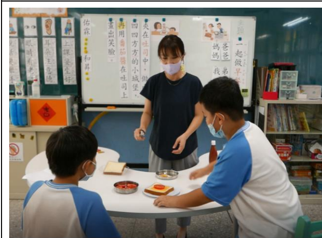
相片說明：學生將利用實物，依照句子出現語詞順序做出來，將句子畫面化。