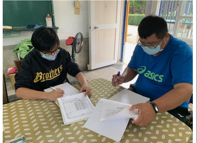
備課說明：預定流程說明與演練