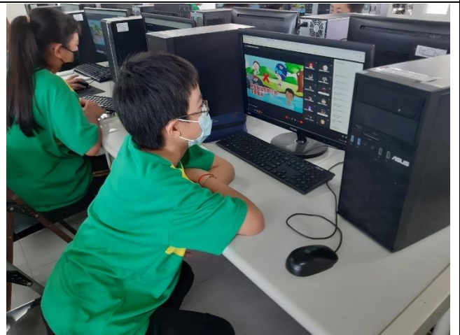
公開課說明：水域安全影片