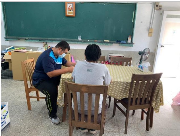
議課說明：課程設計與教學討論