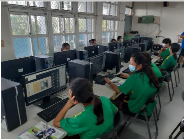
公開課說明：台灣的危險水域