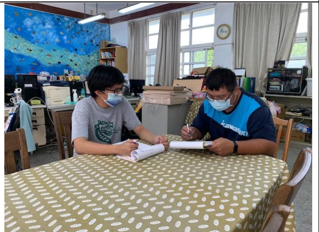
議課說明：課程設計與教學討論