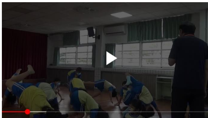
引起動機-講解支撐動作的重要概念