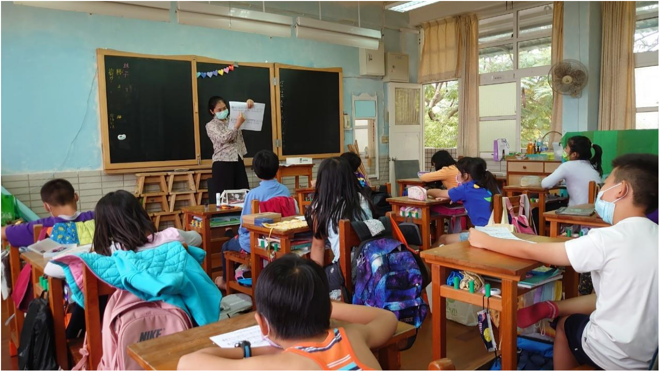
公開課堂照 3-心智圖提詞討論