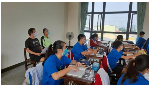
說明：兩位觀課老師到班觀課