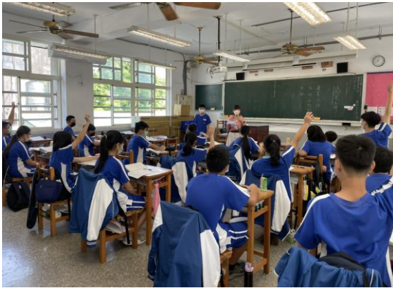
公開授課情形-學生回答