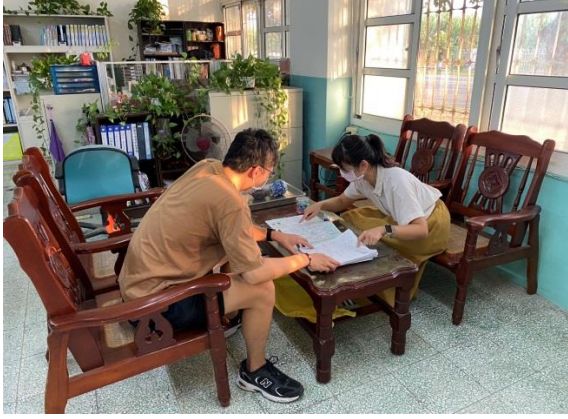
觀課前會議-說明教案設計