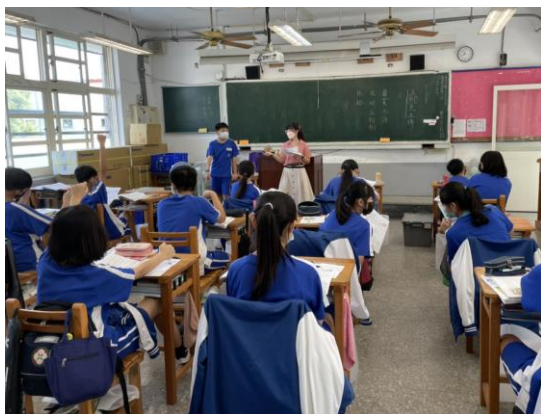
公開授課情形—學生發表