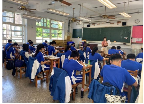
公開授課情形-教師說明