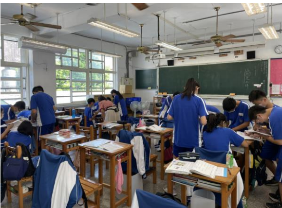
公開授課情形—學生討論