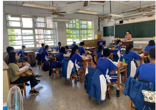
公開授課情形—觀課教師