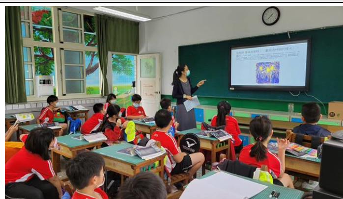
教學照片（至少四張）