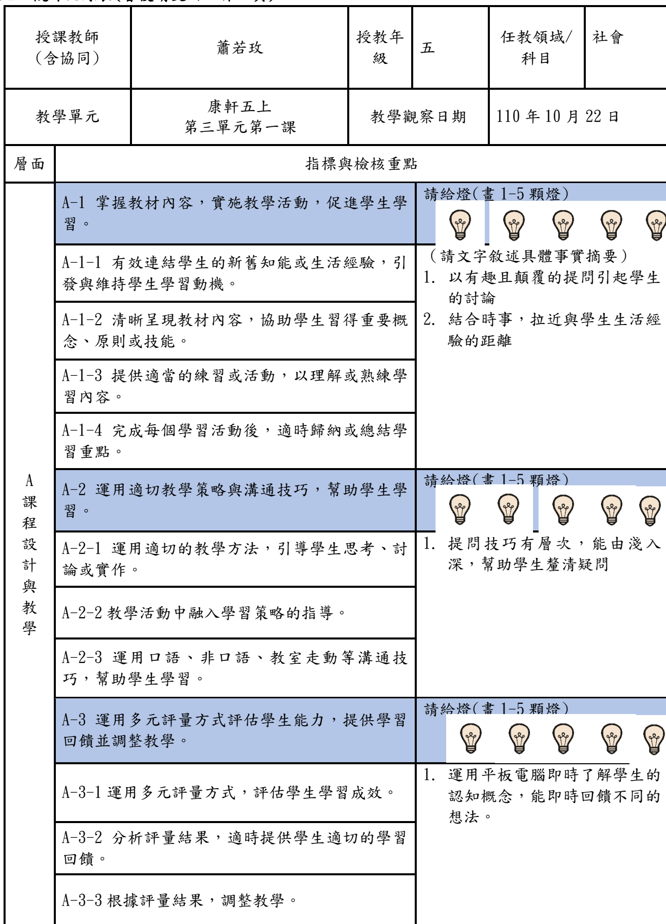
表 2、觀課紀錄表(會後請交回工作人員)