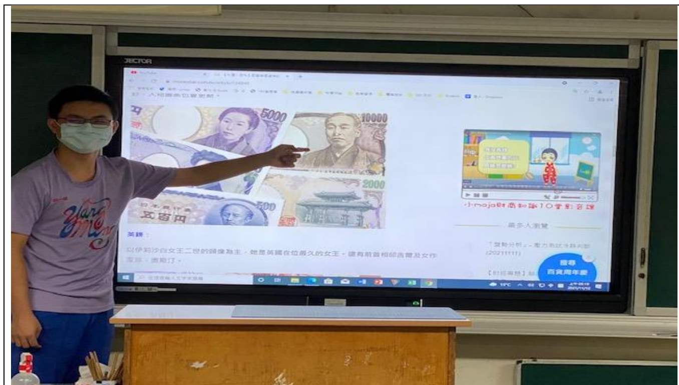
照片1說明：(學生上台介紹外國貨幣的特色)