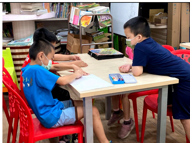
學生討論與平板操作