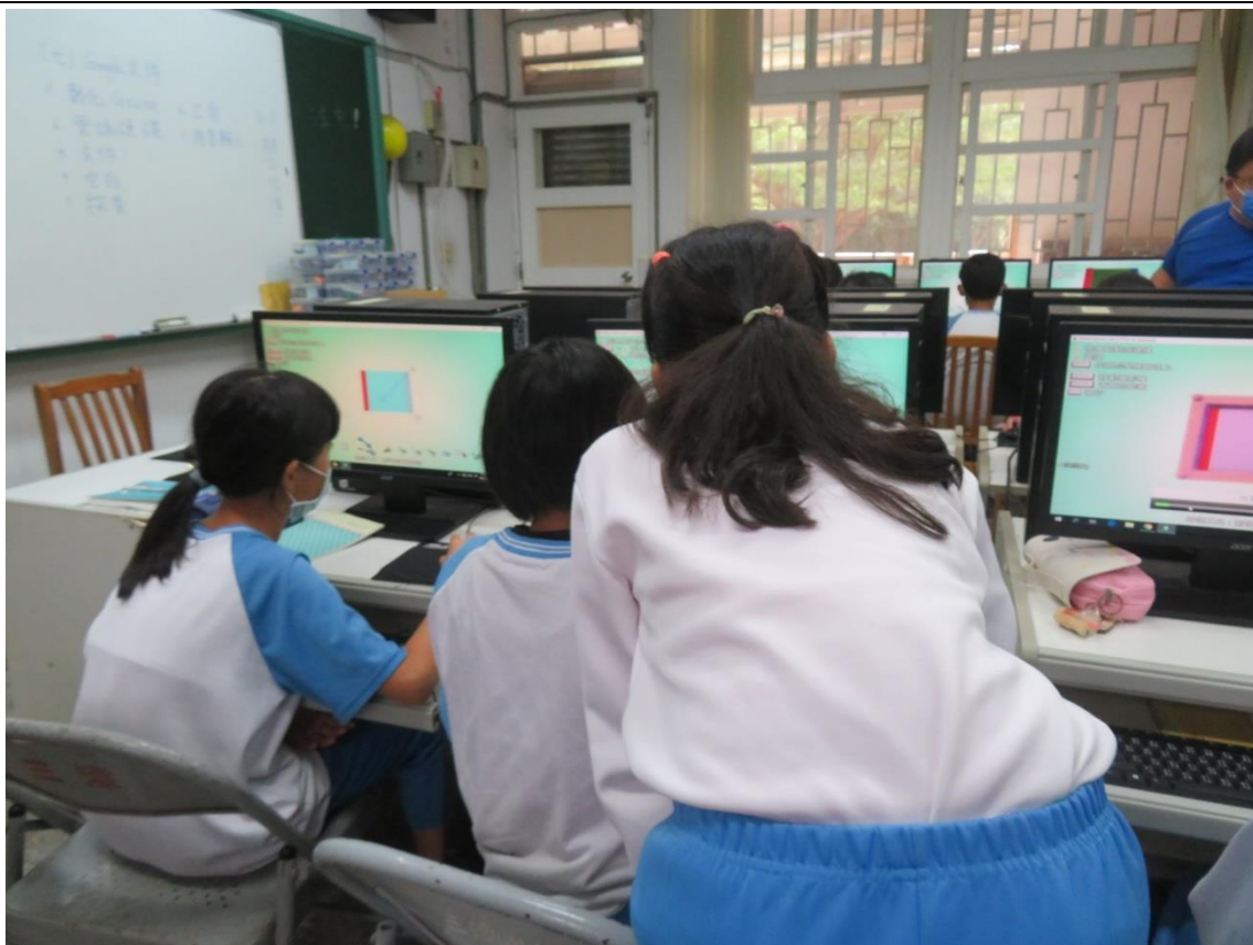
相片說明： 小老師協助指導學童