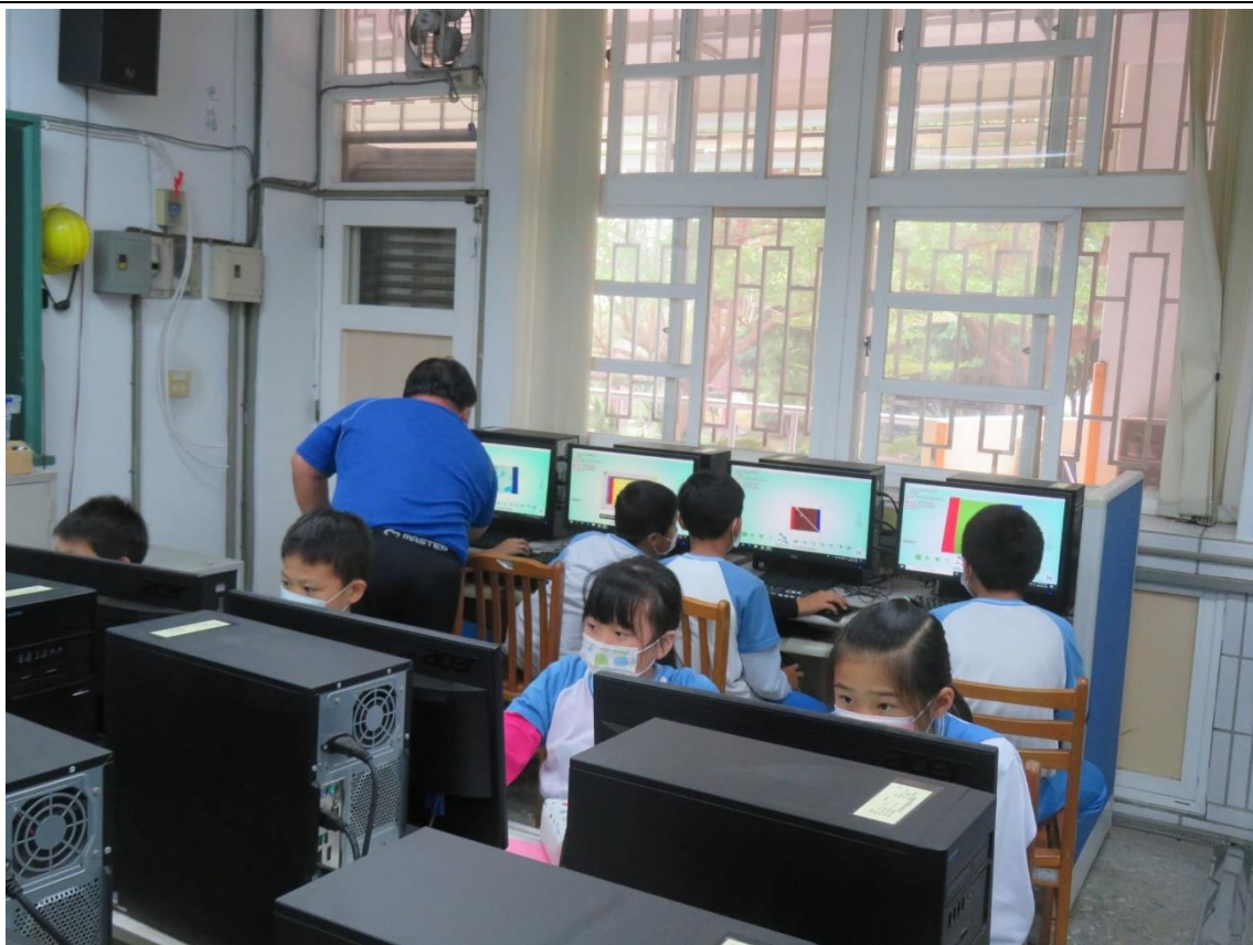
相片說明： 教師行間巡視，解決學童問題