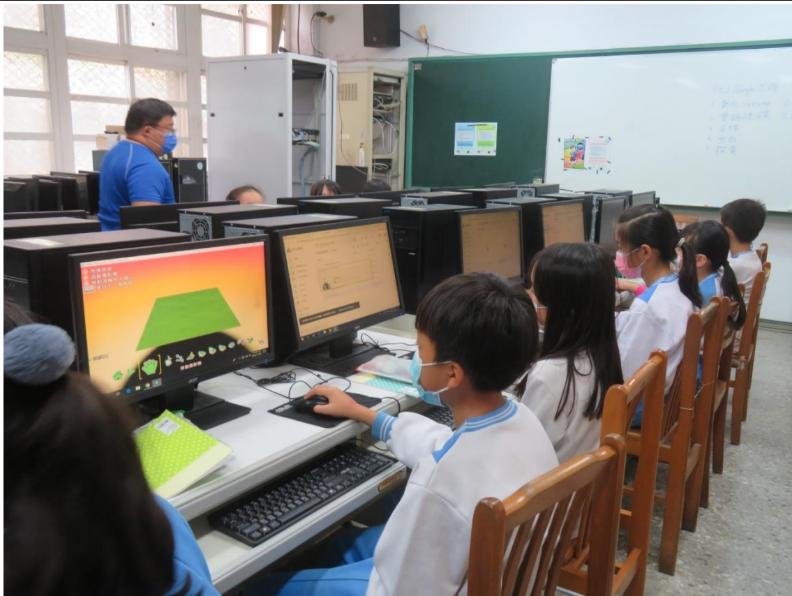
相片說明：教師巡視學童操作情形