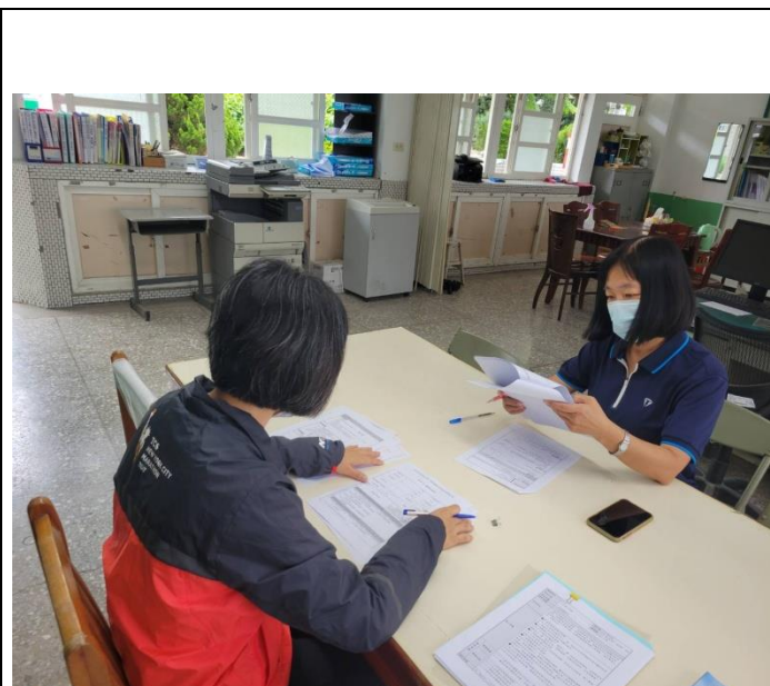
說明：觀課者與授課教師討論