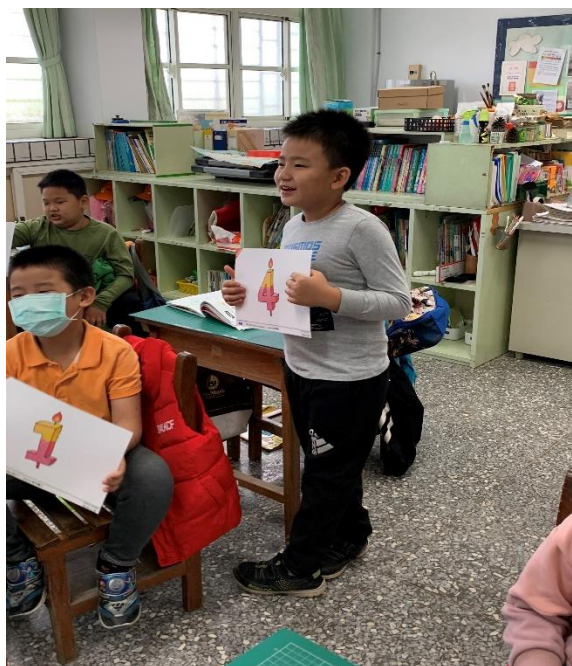
學生根據抽到的卡， 回答「I am ? years old.」