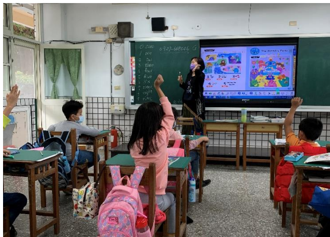
學生以英文說出家人的電話