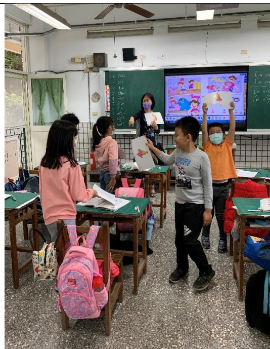
學生分組彼此間互相對話