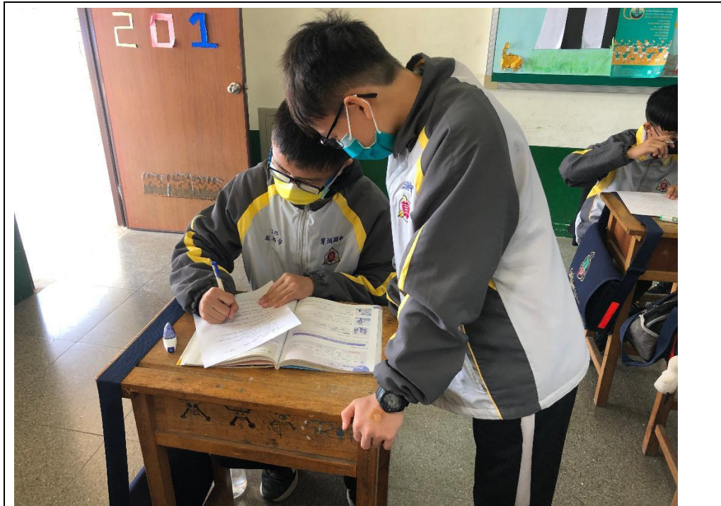
完成的同學協助需要輔導的同學