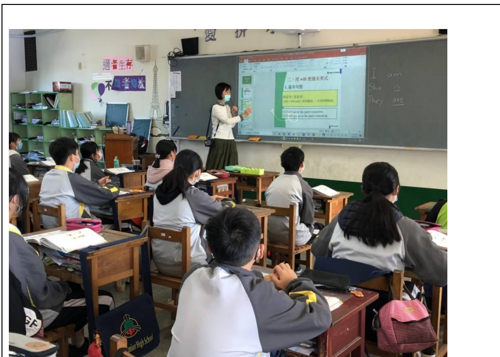
用簡報複習未來式的觀念