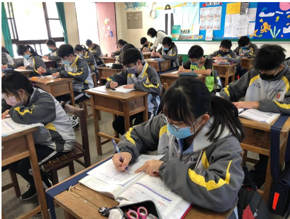
大部分學生都能參考課本完成學習單