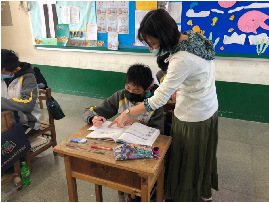
個別指導落後的學生